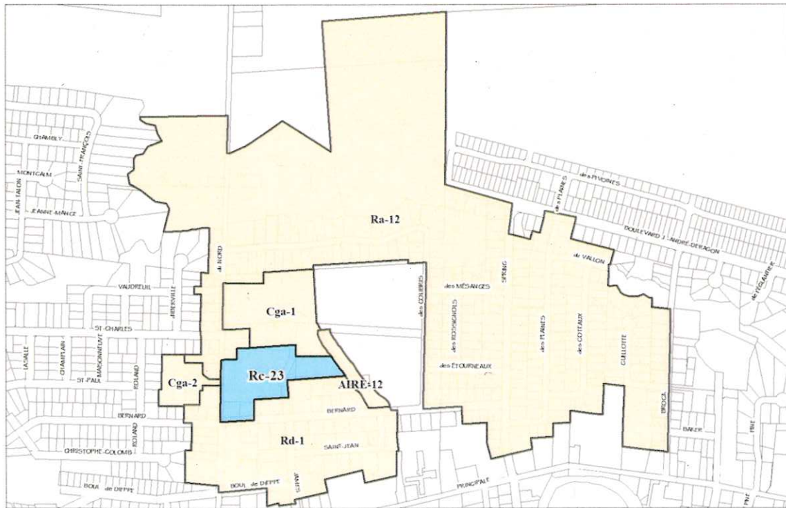
(Secteur des rues James et du Nord.)

La zone concernée, par la disposition 2) ci-haut, est constituée de la zone Rc-23 et des zones contiguës Cga-1, Ra-12, AIRE-12, Rd-1 et Cga-2 qui sont illustrées au croquis suivant :