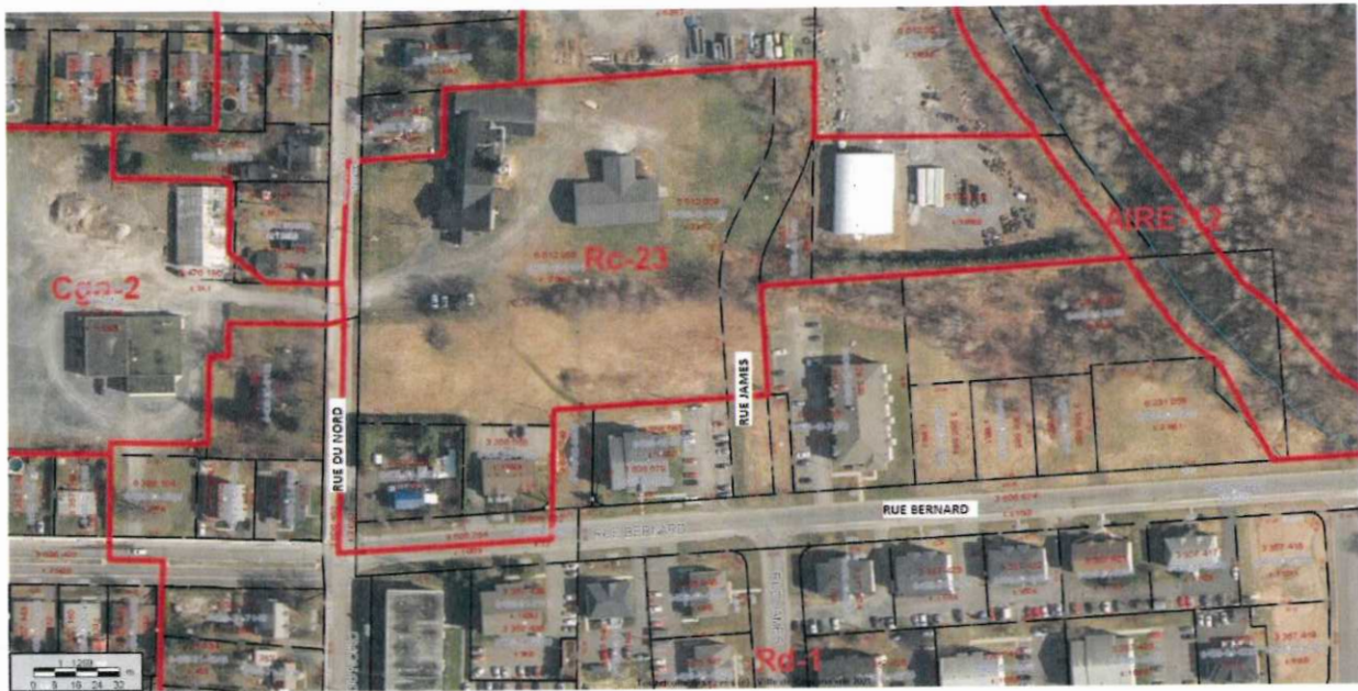
(Secteur des rues James et du Nord.)

Le secteur visé par l'objet 2 ci-haut, situé dans le secteur des rues James et du Nord, est identifié ci-dessous :